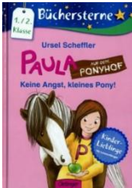
Paula auf dem Ponyhof: Keine Angst, kleines Pony!