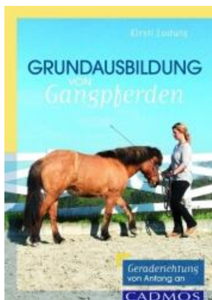
Grundausbildung von Gangpferden

inkl. 7% MwSt., inkl. Versandkosten für Deutschland