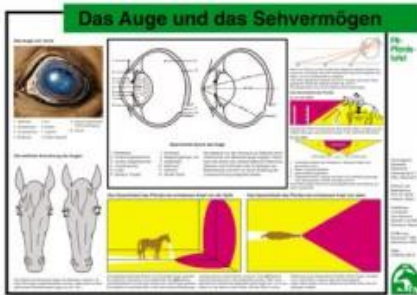
Lehr-/Pferdetafel (A4) - Das Auge und das Sehvermögen