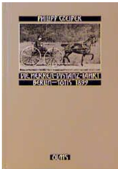
Die Herren-Distanzfahrt Berlin - Totis 1899